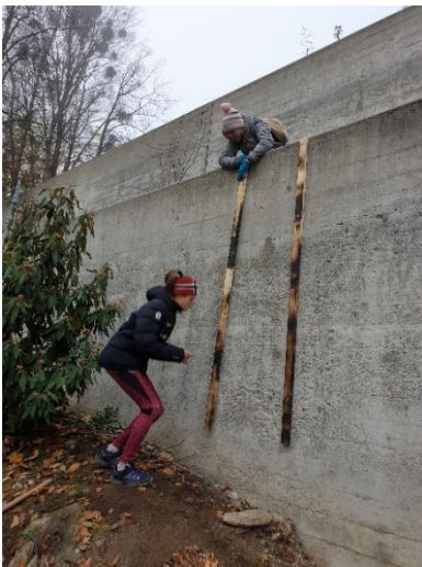
Aufbinden von Kletterpflanzen