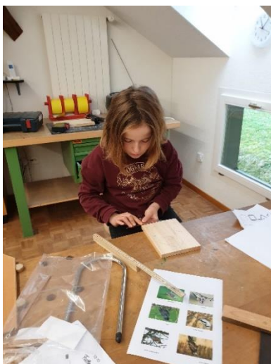
Futterstellen und Nistkästen für Vögel