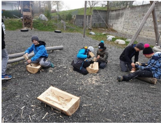
Wassertröge für Vögel